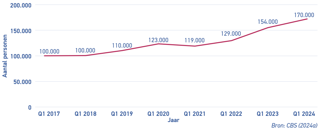
Grafiek 1: Aantal zzp'ers in Nederland met een beroep in Zorg en Welzijn

De recentste cijfers van het CBS (2024a) laten zien dat er in het 1 e kwartaal van dit jaar 170.000 zzp'ers actief zijn die een beroep in Zorg en Welzijn uitoefenen. Dit is een stijging van 10,4% ten opzichte van het jaar ervoor. Het aantal zzp'ers in de zorg neemt al jaren toe. In 2021 was er een lichte daling, maar sindsdien groeit het aantal zzp'ers onverminderd door.