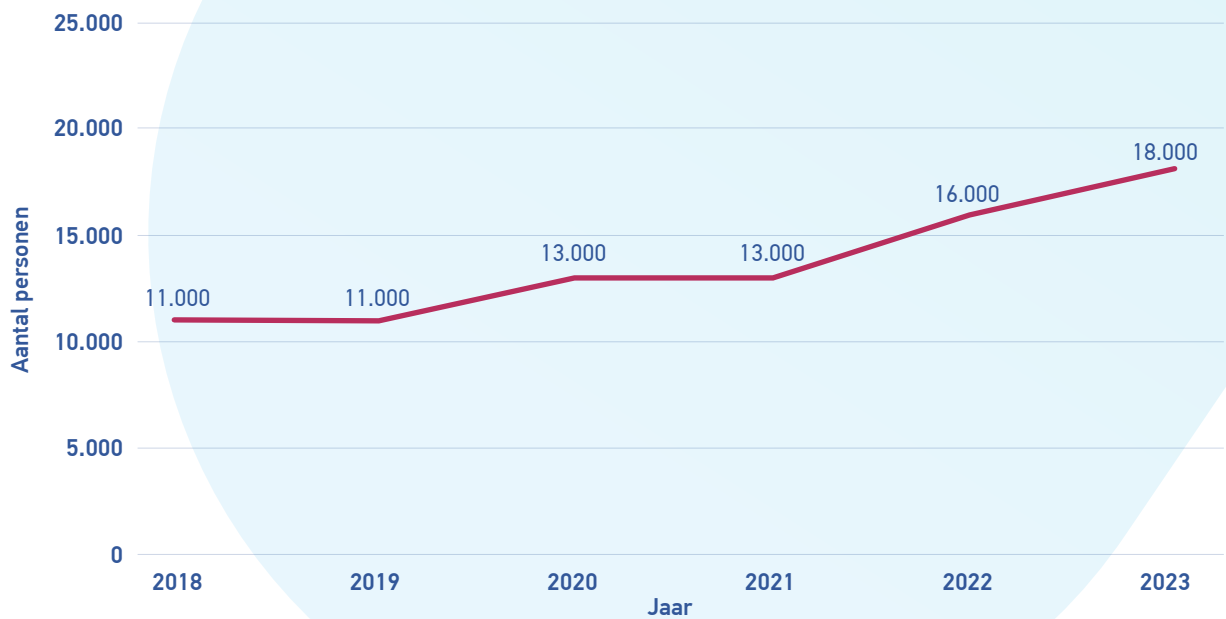
Grafiek 3: Ontwikkeling aantal zzp'ers in Zorg en Welzijn; regio ZWconnect